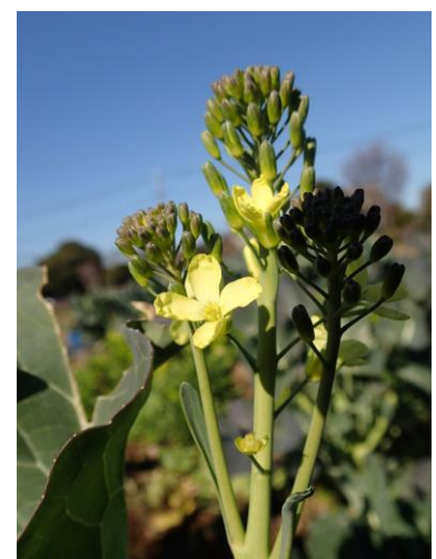
スティックセニョール